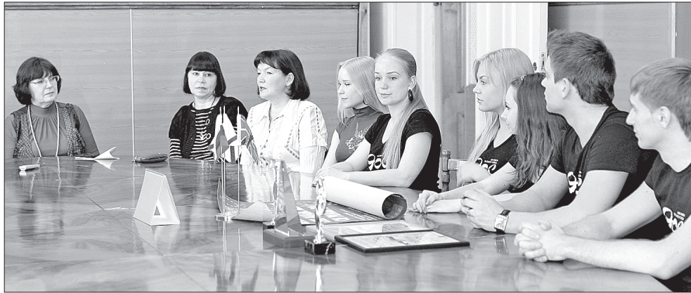
Пресс-конференция для журналистов

На пресс-конференции для северодвинских журналистов руководители и специалисты Дома корабела высказали огромную благодарность Севмашу, профсоюзному комитету предприятия, областной территориальной