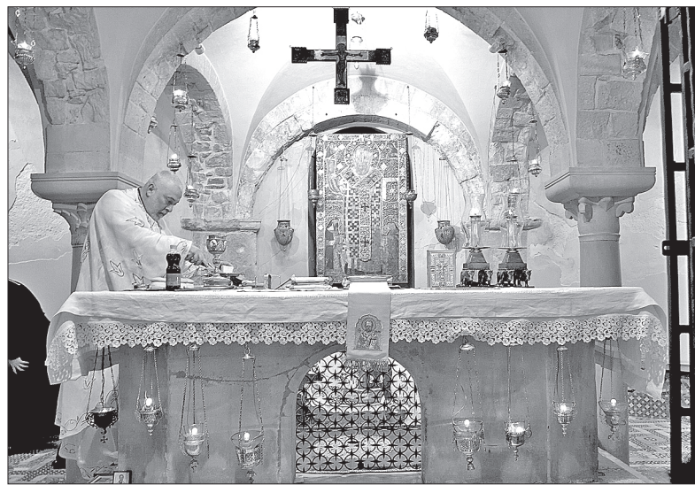
Бари. Гробница св. Николая в базилике его имени