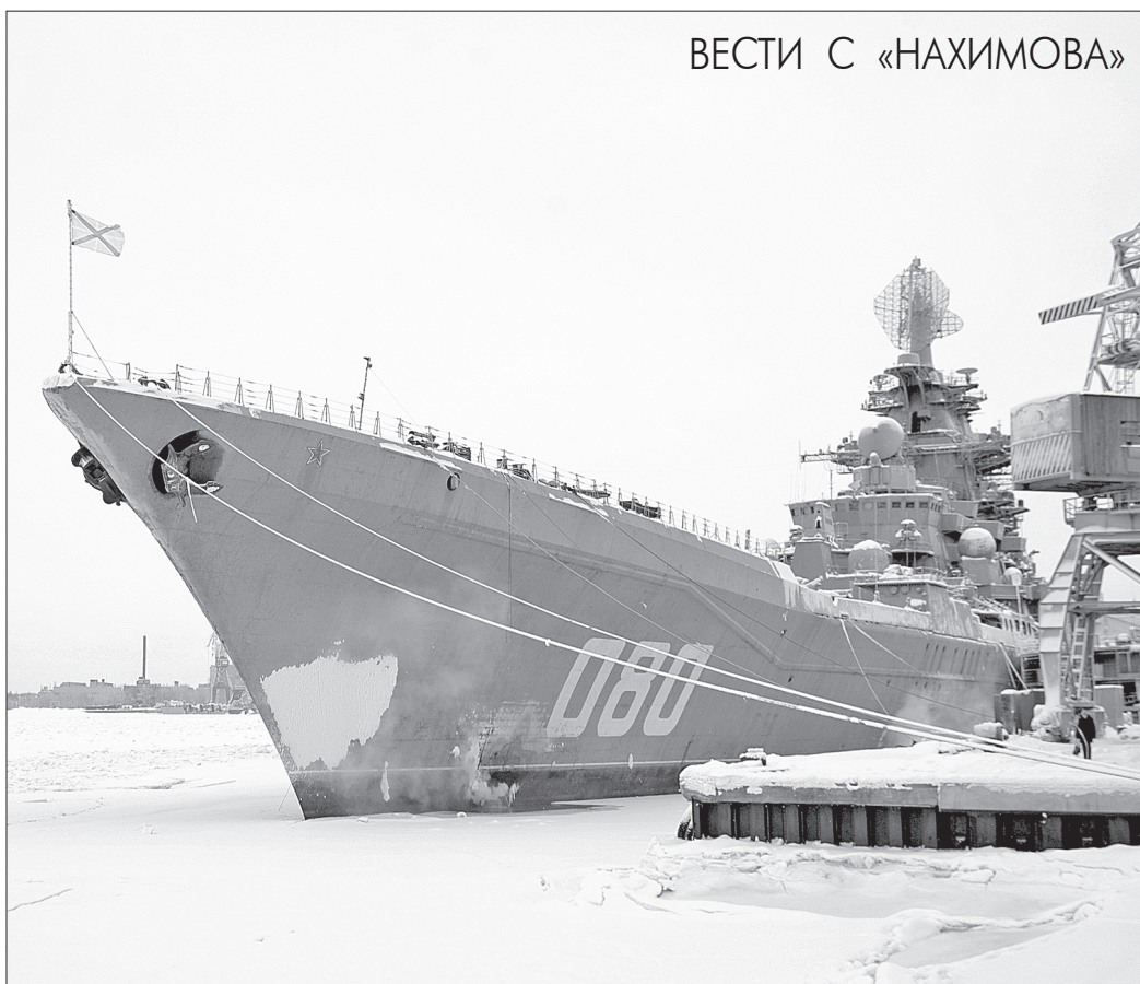
ВЕСТИ С «НАХИМОВА»

Если из всех задач выделить главные, то можно сказать следующее. Сегодня объём демонтажных работ, определённый проектантом «Нахимова», предприятию известен. Большая часть оборудования подлежит демонтажу и выгрузке именно в текущем году, так что цели определены, задачи поставлены, графики выполнения работ оформлены. Распределены по корабельным заведениям работники привлекаемых цехов. Выполнение запланированных объёмов постоянно отслеживается и контролируется. Процесс идёт.