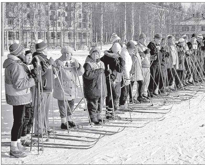
На старте ветераны-лыжники

Под таким названием в конце марта на стадионе «Север» прошли традиционные соревнования по лыжам среди ветеранов города.