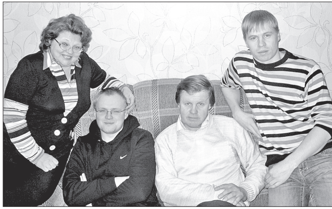
В узком семейном кругу