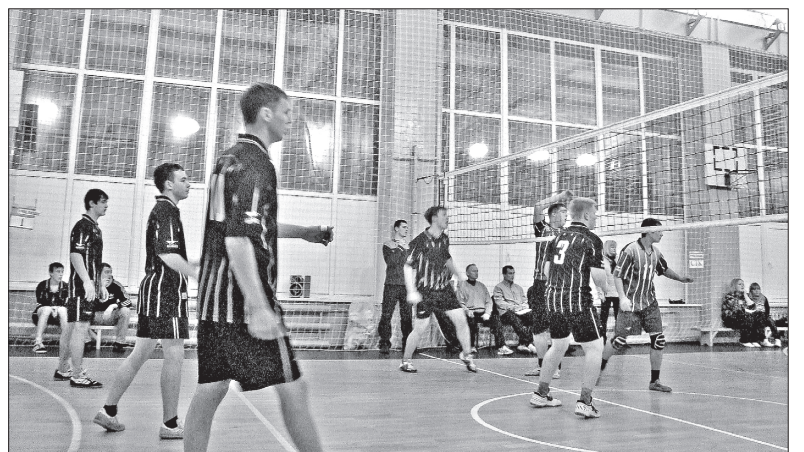
Интрига на площадке сохранялась до финала